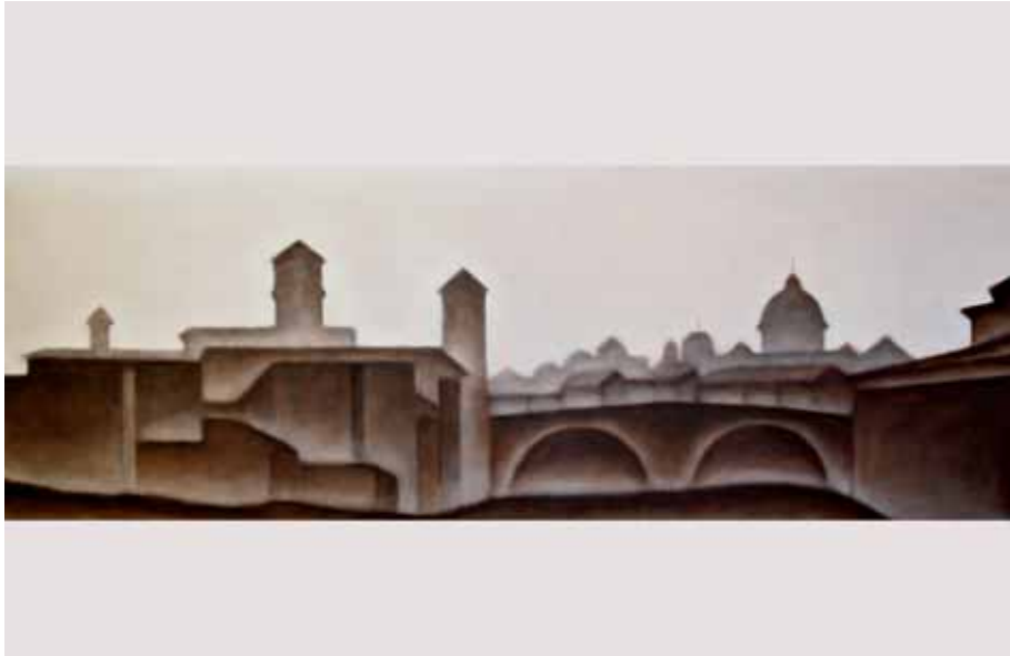
PONTE FABRICIO 2007 olio su tela cm 100x150