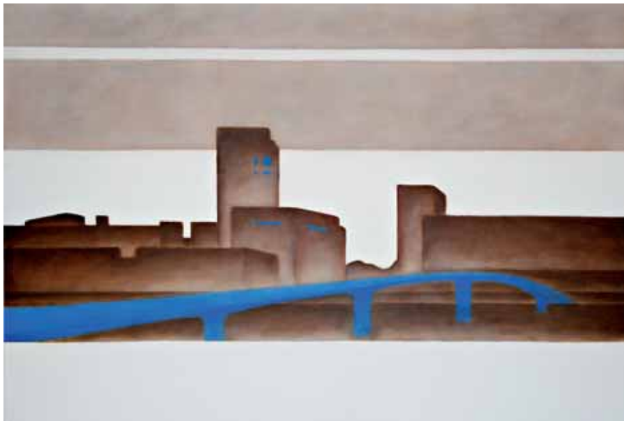
EL PUENTE DE LA MUJER 2007 olio su tela cm 100x150