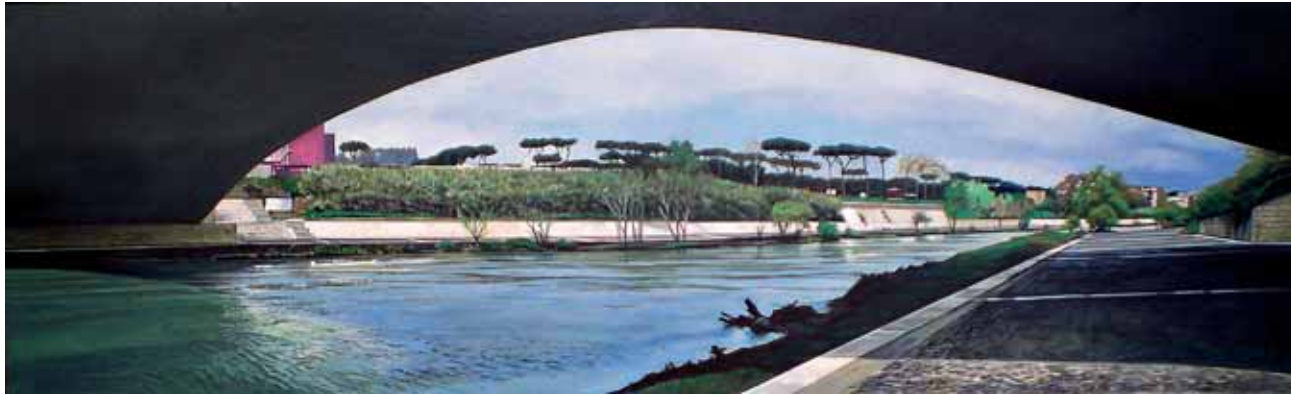
PONTE SOTTO 2007 olio su tavola cm 38x125