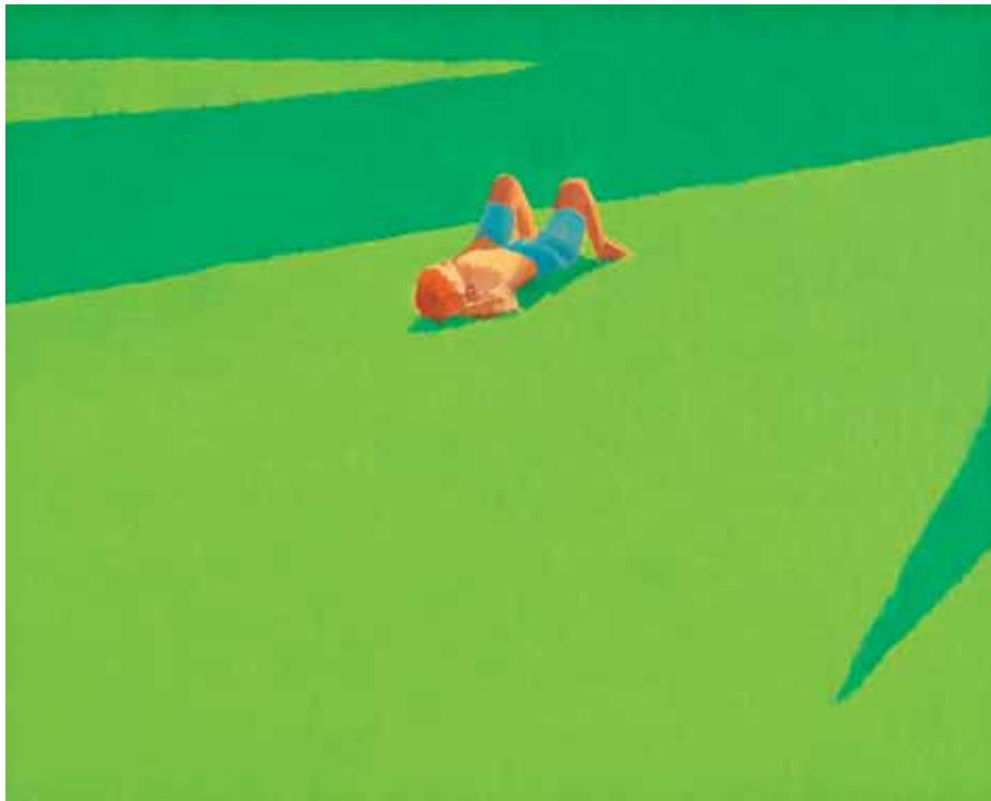
COI CAPELLI ROSSI, VILLA CELIMONTANA, ROMA 2007 olio su tavola cm 20x30