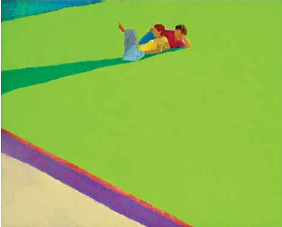
COPPIA, VILLA CELIMONTANA, ROMA 2007 olio su tavola cm 20x30