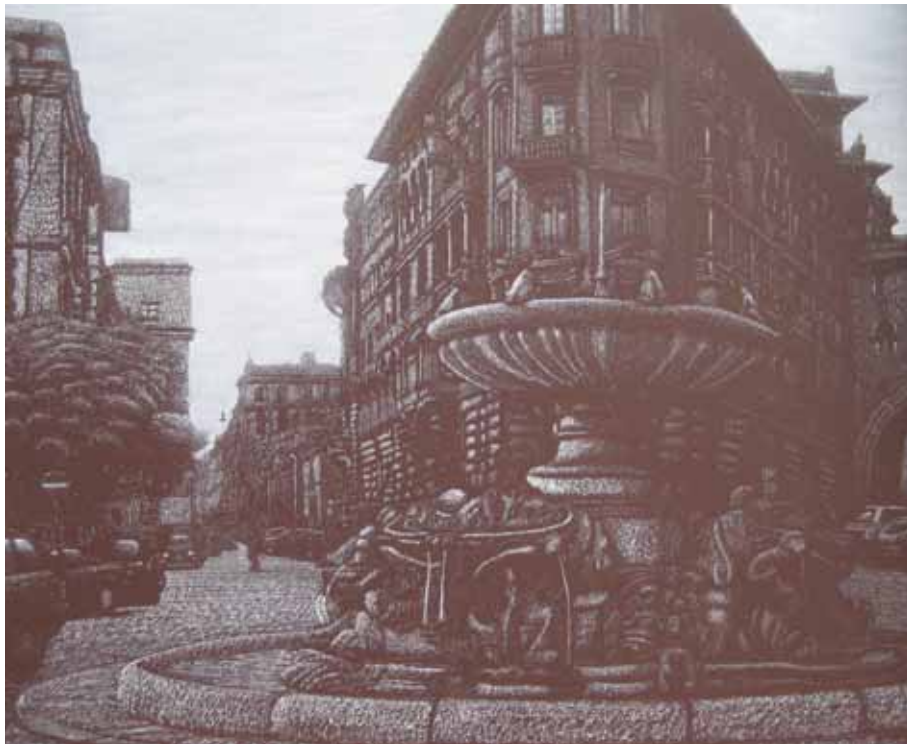
PIAZZA MINCIO 2007 olio su tela cm 100x120