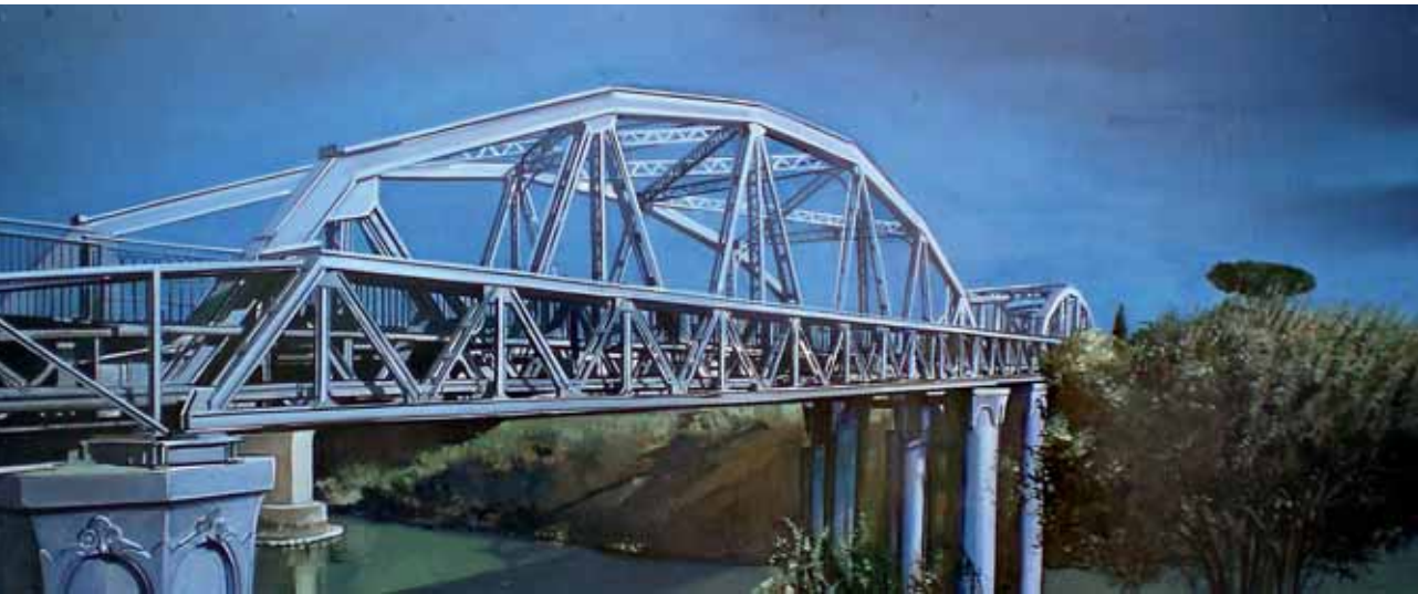
PONTE DI FERRO 2007 olio su tavola cm 32x76