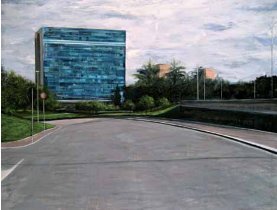
EUR ENI 2006 olio su tela cm 90x120